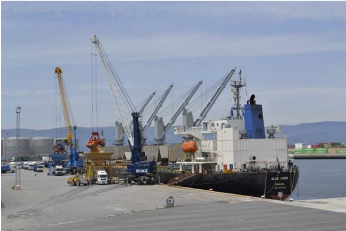
Descarga de 33.000 toneladas de cereal

El puerto de Vilagarcía acogió en el mes de mayo de una de las mayores descargas de año. El buque protagonista fue el "Blue Sand", con bandera de Panamá, y la mercancía, 33.000 toneladas de maíz que fueron desembarcadas en el muelle de Comboa. La escala estuvo consignada por la empresa P&J Carrasco.