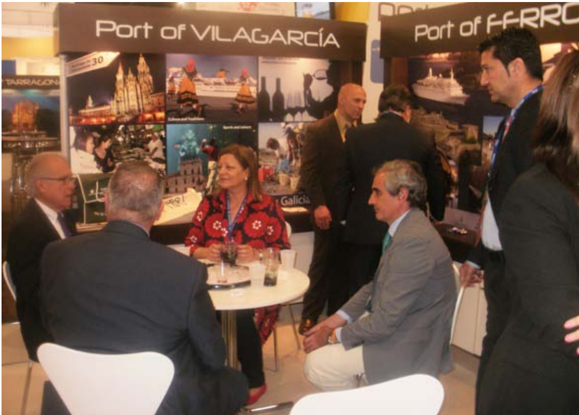
Promoción del Puerto en la feria Seatrade Miami

El Puerto de Vilagarcía acudió el pasado año -dentro de una delegación de la que formaron parte diversas Autoridades Portuarias españolas- la feria internacional más importante del sector crucerístico, Seatrade Miami. La presencia del Puerto de Vilagarcía en este evento sirvió para promocionarse como alternativa para el tráfico de cruceros en el noroeste y fachada atlántica peninsular. Los atractivos de la ciudad de Vilagarcía y la comarca de O Salnés, con la posibilidad de realizar una gran variedad de actividades de ocio y tiempo libre, centraron la propuesta arousana en Seatrade Miami.